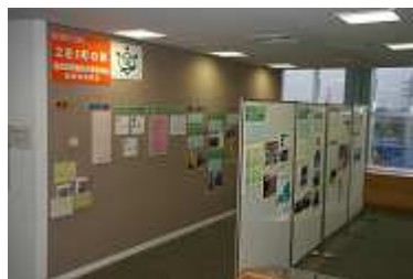
〔寒川文書館のパネル展会場〕

過去の写真や公文書を使って紹介する巡回パネル展を、寒川町会場、藤沢市会場、茅ヶ崎市会場の順で開催しています。最新の情報は、裏面の「この時期のトピック」をご覧ください。