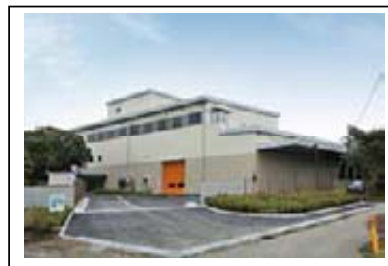
〔寒川広域リサイクルセンター〕

茅ヶ崎・寒川地域については、平成24年4月に寒川広域リサイクルセンターが稼働し、藤沢地域においては、平成25年度の稼働に向けて建設工事を進めています。