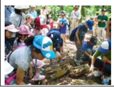
〔セミナー参加の子どもたち〕

7月から8月にかけては、レジ袋の削減による地球環境の保全・地球温暖化防止について考えるきっかけづくりとその意識啓発を目的に、エコバッグのシンボルマークを題材にした絵画コンテストも実施しました。