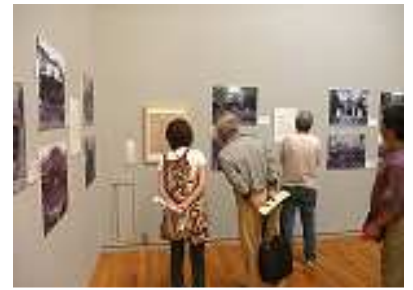
〔資料展会場の様子〕