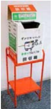
〔設置した専用回収箱〕

また、地球温暖化防止に向けた取組の一環として、リサイクル可能な資源である使用済みインクカートリッジの回収を促進する「インクカートリッジ里帰りプロジェクト」に参加し、2市1町の庁舎等に専用回収箱を設置するなど、廃棄物の減量や資源循環型社会の形成に向けた取組も行っています。皆様もぜひご参加ください。