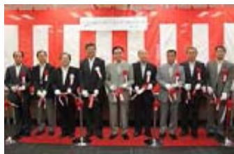
〔開設記念式典の様子〕

住民サービスの向上を図るための広域連携施策の一つとして、県から旅券発給事務の権限移譲を受け、平成24年7月に湘南パスポートセンター(藤沢市・茅ヶ崎市・寒川町)を開設しました。